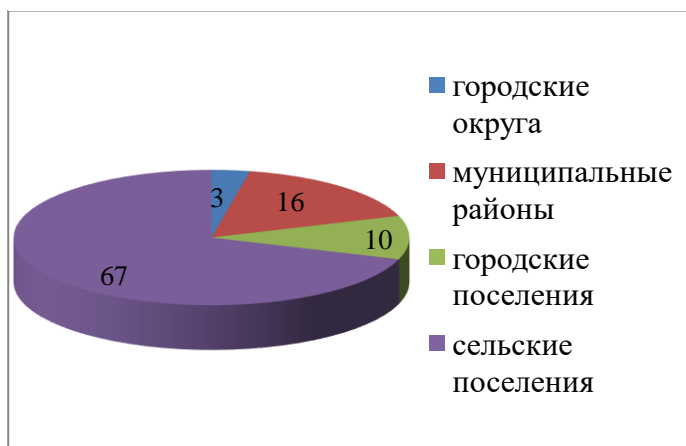
Рисунок 1 Муниципальные образования Ярославской области на 1 января 2020 года

области» произошло объединение Нагорьевского, Пригородного и Рязанцевского сельских поселений, входящих в состав Переславского муниципального района, с городским округом город Переславль-Залесский и в настоящее время на территории Ярославской области образовано 96 муниципальных образований: 3 городских округа, 16 муниципальных районов, 10 городских и 67 сельских поселений.