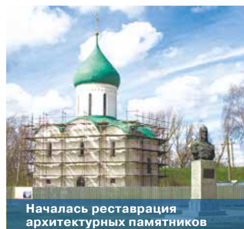
Началась реставрация архитектурных памятников

Также в Переславле планируется развивать предприятия фарминдустрии. Одно из таких предприятий – ЗАО «Фирма «Витафарма», уже открылось в городе. Основное направление его деятельности – разработка, создание и выпуск иммунобиологических препаратов. В настоящее время половину ассортимента линейки этого предприятия составляют входящие в список жизненно необходимых препараты, и увеличение их производства позволяет успешно ре-