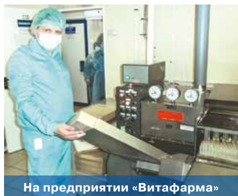
На предприятии «Витафарма»

что продажа освобожденных участков позволит не только получить новые поступления в казну, но также даст городу новых налогоплательщиков, которые, работая здесь, и в будущем станут регулярно пополнять городской бюджет.