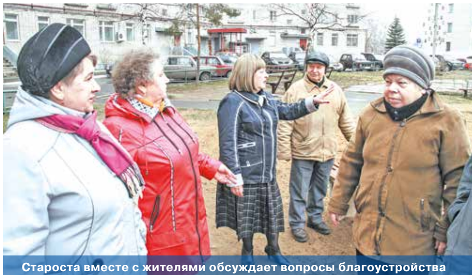
Староста вместе с жителями обсуждает вопросы благоустройства

не рвалась. Как человек, привыкший обдумывать свои действия, решение приняла не сразу, тем более что вопрос этот возник в достаточно сложное время. 2008 год ознаменовался для Рыбинска началом реализации программы капитального ремонта многоквартирных жилых домов. Сложность была еще и в том, что назрела необходимость попрощаться с прежней управляющей компанией.