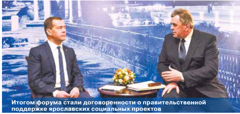
Итогом форума стали договоренности о правительственной поддержке ярославских социальных проектов

Также участники форума высказались за продление выплаты пособия детям старше полутора лет, не посещающим дошкольные учреждения, за расширение возможностей программы профессионального обучения для пенсионеров, желающих продолжить свою трудовую деятельность, за улучшение условий для пожилых людей, проживающих