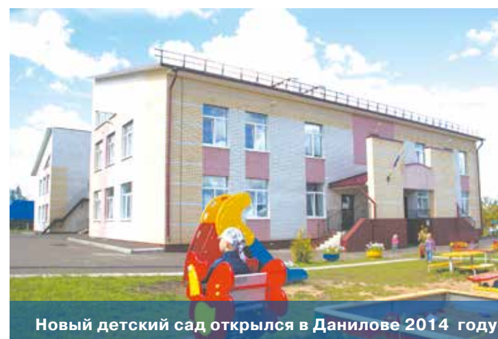
Новый детский сад открылся в Данилове 2014 году

ное открытие Школы искусств после реконструкции.