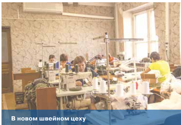
В новом швейном цеху