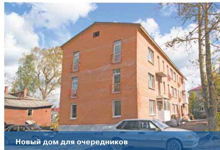
Новый дом для очередников