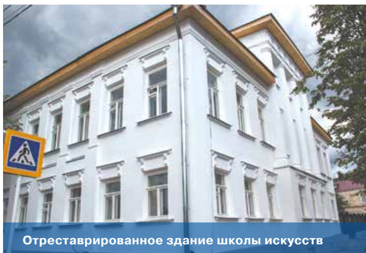
Отреставрированное здание школы искусств