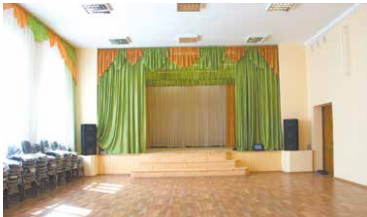
Обновленный зал и сцена

Поводом для приезда ярославских гостей стал не только праздник села, но и приуроченное к нему открытие после капитального ремонта здания Середского Дома культуры, который был отремонтирован по ведомственной целевой программе «Сохранение и развитие культуры Ярославской области». В ее рамках в 2015 году на капитальный ремонт ДК в селе Середка было выделено 3 миллиона рублей. Еще 500 тысяч рублей добавил бюджет Даниловского района. На эти средства отремонтировали крышу, полностью заменили окна, полы, сделали новую сцену. Также для ДК была приобретена новая мебель: 60 кресел для зрительного зала, новые шторы; две стенки и столы в кабинеты сотрудников. Что немаловажно, в Доме культуры сделаны современные санузлы (раньше туалет находился на улице), полностью заменена система отопления.