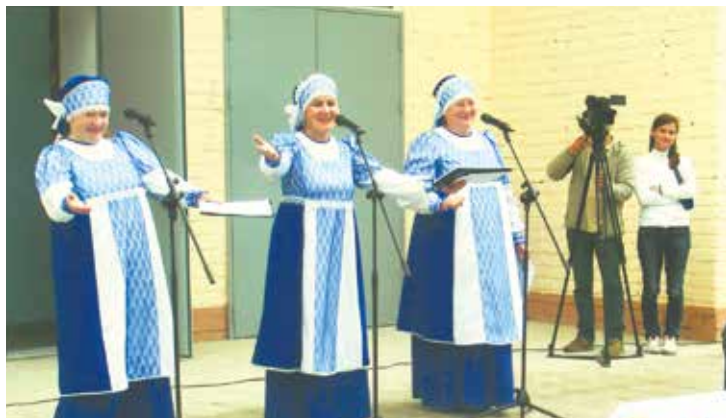
Праздничное открытие Середского ДК после капитального ремонта