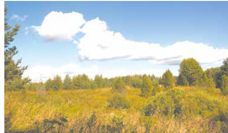
Уникальная можжевельниковая роща в окрестностях поселка Середы

А чтобы на территории поселения было чисто, администрация устанавливает контейнерные площадки в крупных населенных пунктах. В деревнях жители заключают договоры с организацией «Софтпак»,