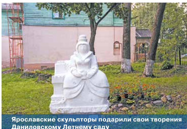
Ярославские скульпторы подарили свои творения Даниловскому Летнему саду