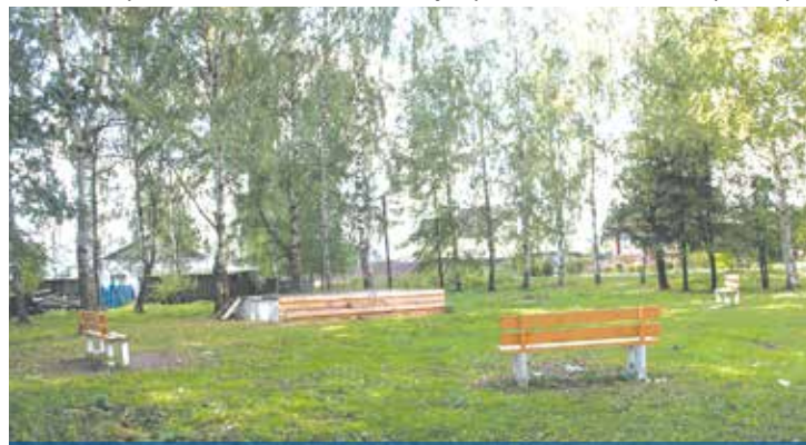
Александровский парк, где проходят праздники, благоустроен силами администрации

которая присылает машину и собирает у населения мешки с мусором. Сейчас практически весь частный сектор охвачен такими договорами, так что проблем стихийными свалками в поселении стало уже меньше. Люди постепенно приучаются содержать свои населенные пункты в чистоте.