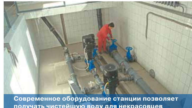
Современное оборудование станции позволяет получать чистейшую воду для некрасовцев