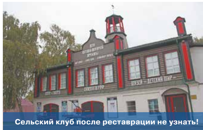
Сельский клуб после реставрации не узнать!

программа по модернизации электрических сетей, на средства областной программы в 2016 году будет построено плоскостное сооружение: многофункциональная спортивная площадка и гимнастический городок рядом со школой.