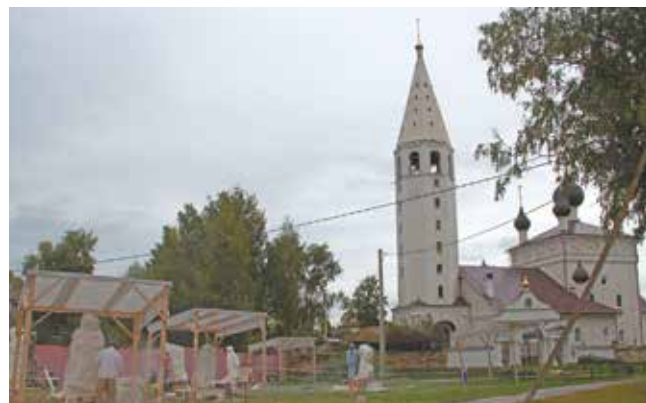
В Вятском всегда что-то происходит: скульпторы работают под открытым небом

Также администрация занимается благоустройством территории села и окрестностей. В асфальтовом покрытии отремонтирована дорога Вятское – Кондорево, где расположен детский сад, куда водят вятских дошколят. В планах реконструкция дорог центральной части Вятского – асфальтирование, строительство автобусной разворотной площадки, пешеходной дорожки до центра села. На территории Вятского реализуется