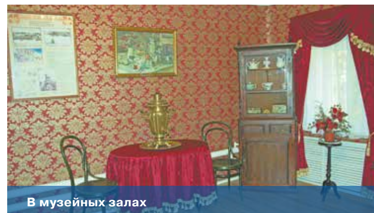
В музейных залах