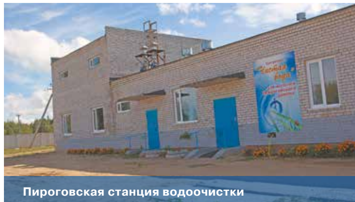
Пироговская станция водоочистки