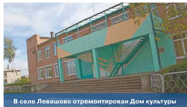
В селе Левашово отремонтирован Дом культуры

монт экспозиционных залов. Теперь здесь просторно, чисто и красиво.