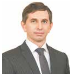
Глава района Н. В. Золотников

Территория муниципального района охватывает 1363,67 квадратных километров. Из них 543,6 тысячи гектаров – это сельхозугодья. В Некрасовском районе постоянно проживает 20466 человек.