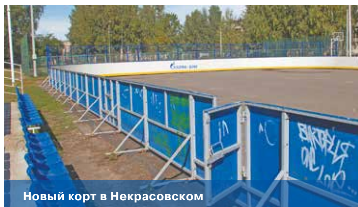
Новый спорткорт в Некрасовском