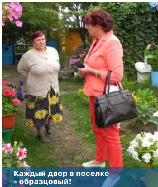
Каждый двор в поселке - образцовый!

составляют всего 449 тысяч рублей в год. Приблизительно столько же – 434 тысячи рублей – дотация на выравнивание бюджета.