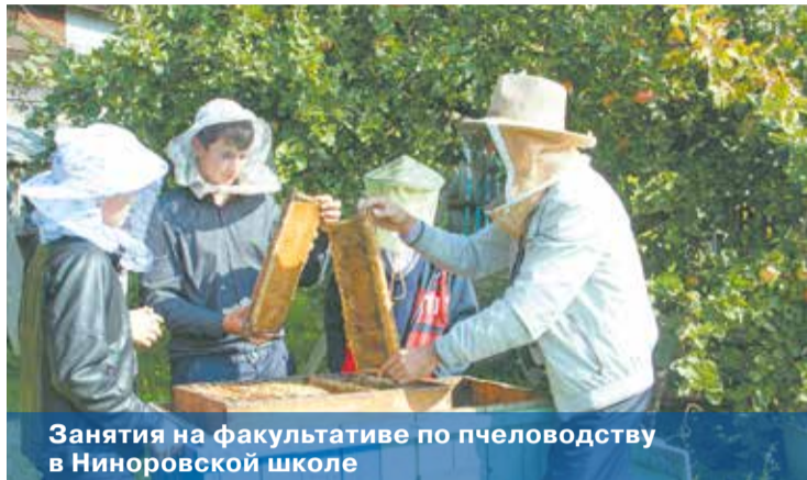
Занятия на факультативе по пчеловодству в Ниноровской школе