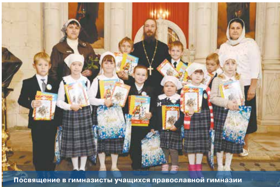
Посвящение в гимназисты учащихся православной гимназии

Продолжила программу городская интеллектуально-патриотическая игра для обучающихся общеобразовательных школ города «Слава предкам – гордость России – потомкам урок», где ребята показали свои знания об эпохе А. Невского. В игре приняли участие команды из всех школ города. Игра организована управлением культуры, туризма, молодежи и спорта совместно с Переславль-Залесским музеем-заповедником и с учреждениями культуры города. Игра проходила в форме квеста: ребята перемещались по территории