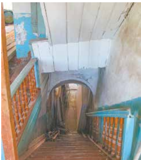
Ремонт в здании Вятской администрации: Так было