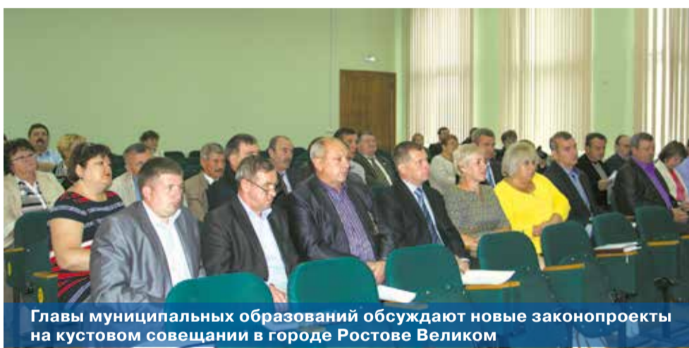
Главы муниципальных образований обсуждают новые законопроекты на кустовом совещании в городе Ростове Великом

Следующее полномочие – ритуальные услуги и содержание мест захоронений. Здесь мы исходили из сложившейся практики и доступности этой услуги для населения. Негуманно было бы гонять родственников умершего в райцентр за получением разрешения на захоронение, если все это можно оформить в местной администрации.