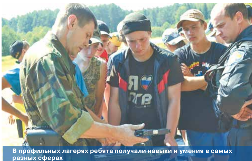
В профильных лагерях ребята получали навыки и умения в самых разных сферах

городским молодежным центром. Здесь тема патриотизма подавалась через различные события русской истории. Ребята участвовали в ролевых играх исторической направленности. Каждый день представлял определенную эпоху, в героев которой и воплощались участники лагеря.