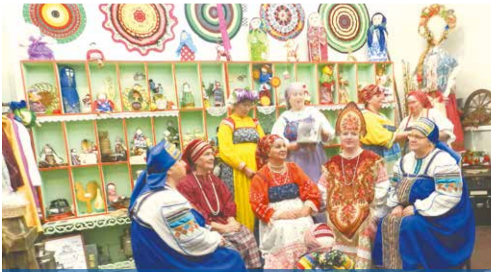
В пестрецовском музее «Колыбель»