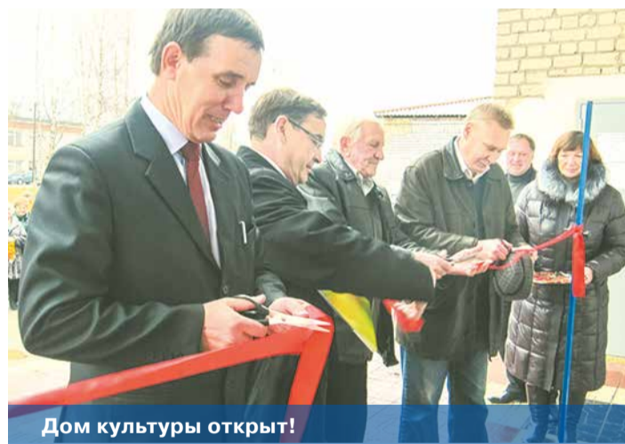
Дом культуры открыт!

Открытие обновленного культурного учреждения не случайно назначили на