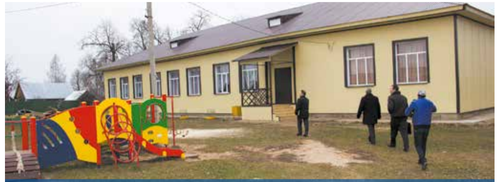
Прозоровский Дом культуры после ремонта

Большое внимание уделяет администрация района и учреждениям культуры и образования в сельских поселениях.