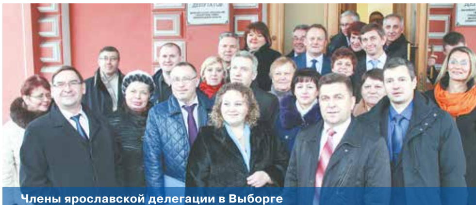
Члены ярославской делегации в Выборге

Выборгский район работает по системе единой администрации с 2008 года. Что это дает району? Во-первых, значительное сокращение численности сотрудников аппарата. Район с населением 200 тысяч человек обслуживает администрация, в штате которой всего