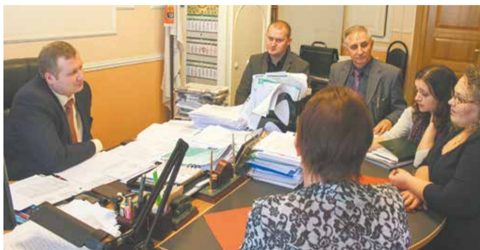
Рабочая группа по вопросам организации объединенной администрации