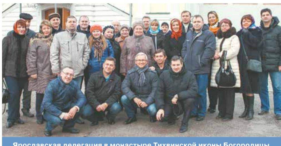
Ярославская делегация в монастыре Тихвинской иконы Богородицы

воспринимается органами власти, и активно участвуют в благоустройстве территории, на которой живут.