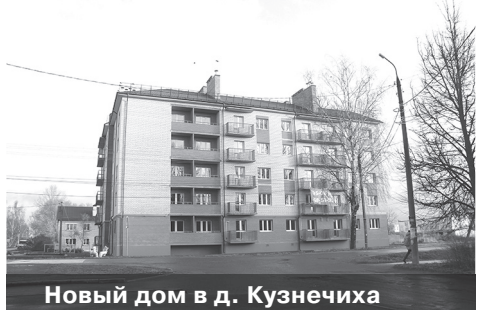
Новый дом в д. Кузнечиха

Пожалуй, одно из самых радостных событий уходящего года – это строительство нового дома в рамках федерального проекта «Расселение ветхого и аварийного жилья». Дом на 50 квартир уже завершен, сейчас идет процесс приемки квартир и передачи их жителям. Всего новоселье в преддверии Нового года справят 43 семьи, которые проживали в ветхих и аварийных домах. Оставшиеся 7 квартир приобретут жители Кузнечихинского сельского поселения.