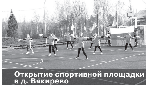
Открытие спортивной площадки в д. Вякирево

культуры. На новой площадке появились и символ Олимпиады – пять колец, и символ Олимпиады-80 – олимпийский мишка, который, как и его старший брат 40 лет назад, улетел в большое путешествие. По традиции был забит первый гол в ворота.