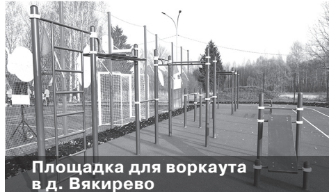
Площадка для воркаута в д. Вякирево