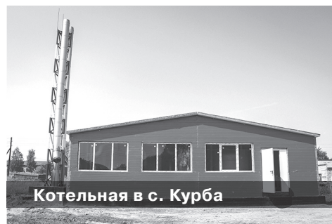
Котельная в с. Курба

– Как в районе решается вопрос с газификацией и ремонтом и строительством дорог?