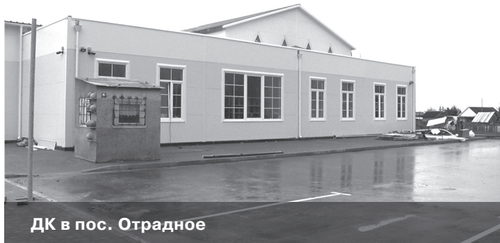
ДК в пос. Отрадное

В поселке Отрадный проживает почти тысяча человек, но за всю его сорокалетнюю историю там никогда не было своего учреждения культуры. А поскольку отрадновцы люди творческие, они создали и самостоятельные коллективы, и клубные объединения, организуя свой культурный досуг в приспособленных