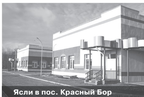
Ясли в пос. Красный Бор

учреждения, после чего ясли откроют двери для малышей.