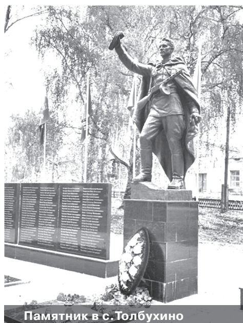
Памятник в с. Толбухино

Также в рамках губернаторского проекта благоустроили дворовую территорию по адресу: деревня Кузнечиха, улица Центральная, д. 8. Сделали ремонт асфальтового покрытия, обустроили парковочные места, провели освещение, установили лавочки.