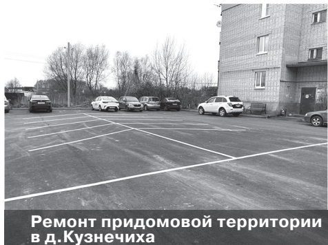
Ремонт придомовой территории в д. Кузнечиха

Также внесли свой вклад в реконструкцию музея и сельхозпредприятия, находящиеся на территории Кузнечихинского сельского поселения, – они помогли в приобретении оборудования. На спонсорские средства был куплен современный видеопроектор, оборудован конференц-зал, где для школьников Ярославского района проводятся уроки истории и краеведения. Ребята могут не только услышать рассказ о событиях военных лет и посмотреть фильмы, но и прикоснуться к реальным свидетельствам той героической эпохи, посетив музейную композицию.