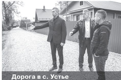
Дорога в с. Устье

Активно идет в сельском поселении и дорожное строительство. В этом году на средства в размере 6 миллионов рублей, выделенные из дорожного фонда, было проложено новое асфальтовое покрытие на улицах в деревне Кузнечиха. За счет собственных средств сельского поселения отремонтировали дороги в селе Устье и в селе Ракино.