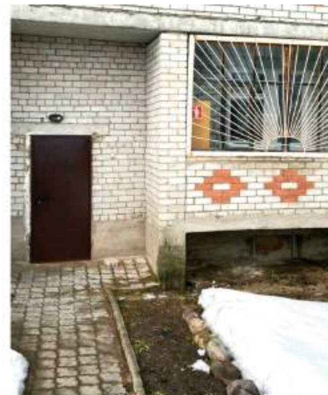
Вход в Детскую музыкальную школу: было – стало

В 2023 году в рамках этого нацпроекта в стране были построены и капитально отремонтированы 75 домов культуры, начали работу 94 кинозала в 38