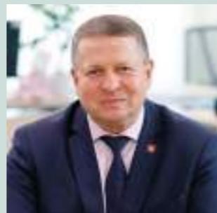
Глава Ростовского муниципального района Андрей Валентинович Шатский