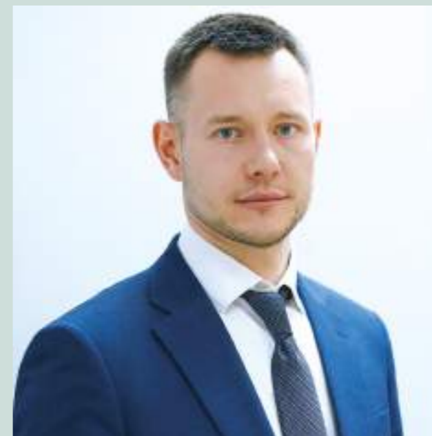
Евгений ЧУРКИН, министр регионального развития Ярославской области