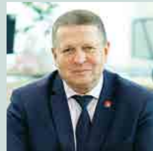
Глава Ростовского муниципального района Андрей Валентинович Шатский