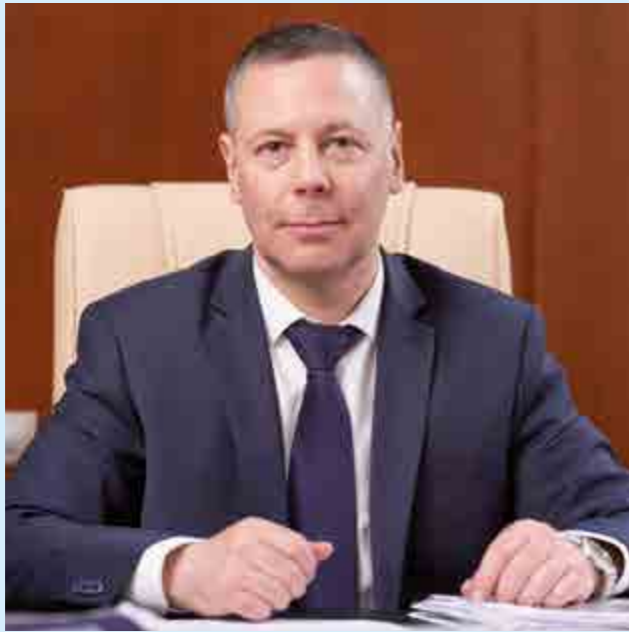
Михаил ЕВРАЕВ, губернатор Ярославской области