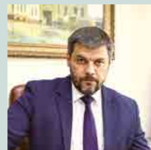
Глава города Рыбинска Дмитрий Станиславович Рудаков