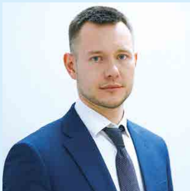
Евгений ЧУРКИН, министр регионального развития Ярославской области